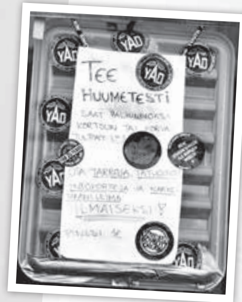
Huumetestit ovat tuttuun tapaan kovassa käytössä.