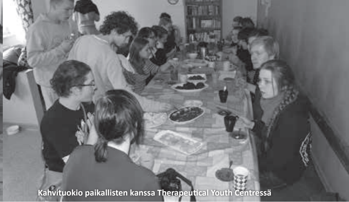
Kahvituokio paikallisten kanssa Therapeutical Youth Centressä

Ruuan siimeksessä pitää välillä myös ottaa lepiä. Me lepäilimme päämajassamme paikallisessa hostellissa. Huoneet joissa majoituimme oli jaoteltu teemoittain: musiikki, remontti (tai joku Puuha-Pete) ja matkustus. Hostellin ulko-ovi kehoitettiin pitämään kiinni ja lukossa jotteivat mm. kylmä ilma, röstäjät, örkit, nazgulit, Voldemort tai Justin Bieber pääse sisään. Hostellissa oli kellon ympäri työntekijä paikalla, vaikka käsitykset läsnäolosta vaihtelivat työntekijöitten kesken. Toinen kun istui tiskin takana taukoamatta ja toinen hävisi silloin tällöin alakerran publiin istuksimaan. Mukavia tyypejä kaiken kaikkiaan, ja oli hauskaa päästä näyttämään heille vähän erilaista suomalaista käyttäytymistä kuin ördäämistä, johon hostellissa oli kuulemma törmätty aikaisemmin.