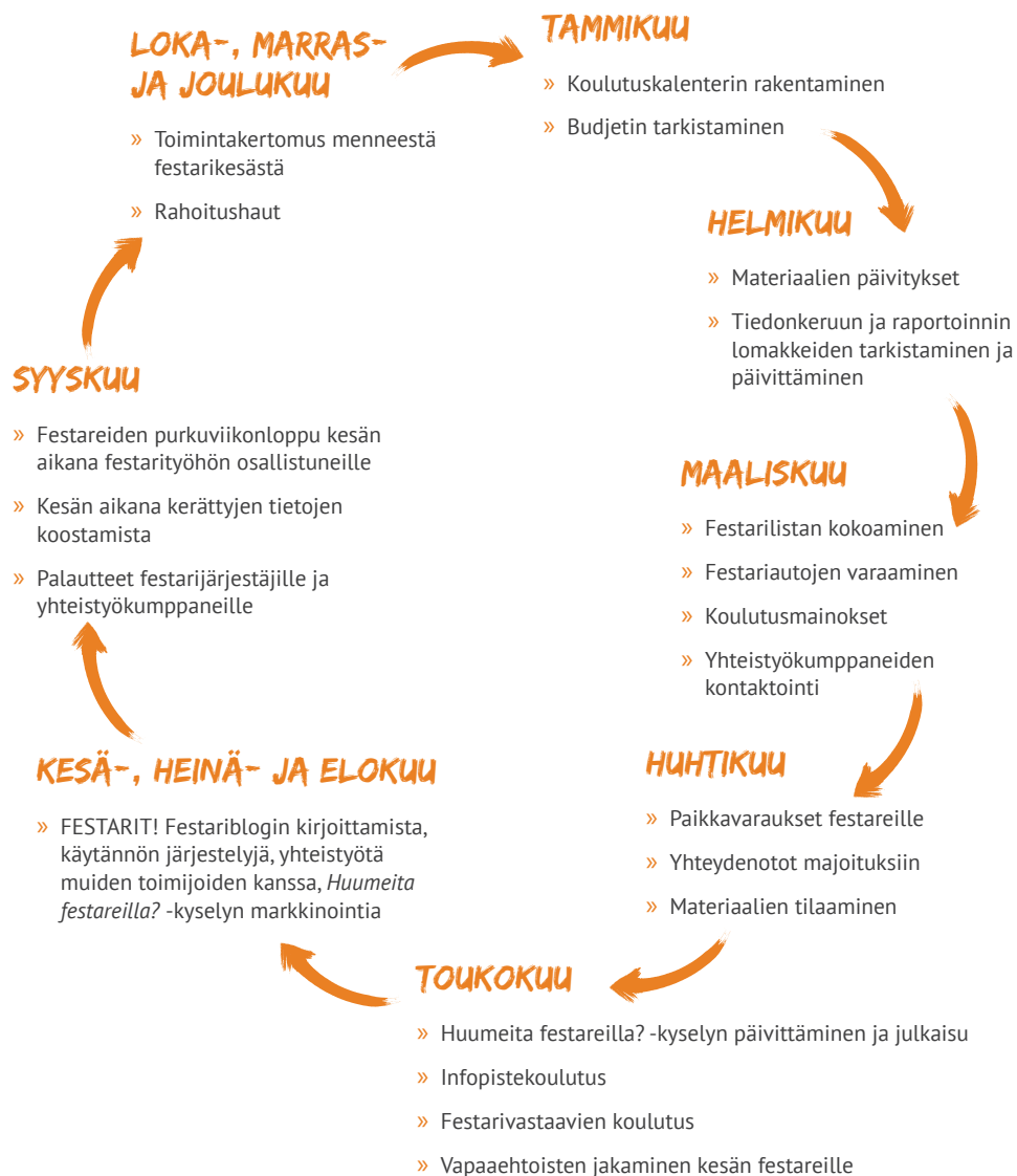
Kuva 2: Festarityön vuosikello